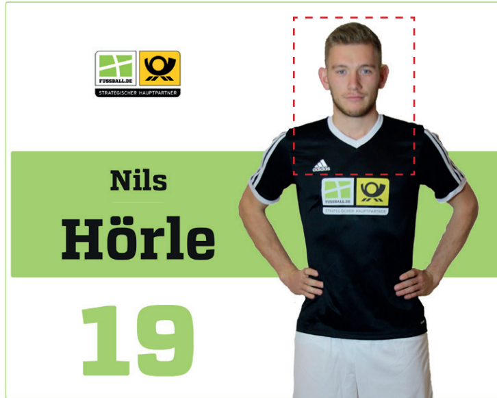
Ausgangsbild vor Zuschneidevorgang

Mit der in DFBnet integrierten Zuschneidefunktion kann das Originalbild ins optimale Format gebracht werden.